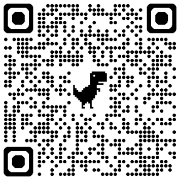
(鄰近大眾交通資訊及停車資訊)

本校。校內停車位以本校教職員為優先使用，若停滿，請將車輛停放於鄰近停車場或路邊停車格，感謝您的配合。(鄰近大眾交通資訊及停車資訊。 https://reurl.cc/oYWx13 )