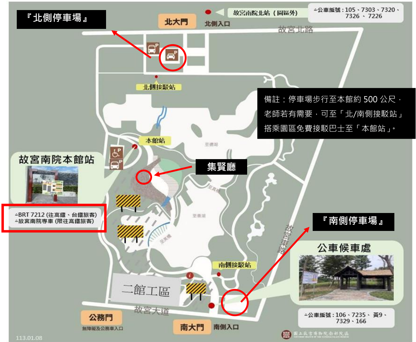
本館館內服務設施平面圖：1F集賢廳