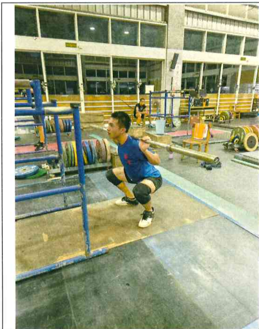
Back squat 示範動作(一)