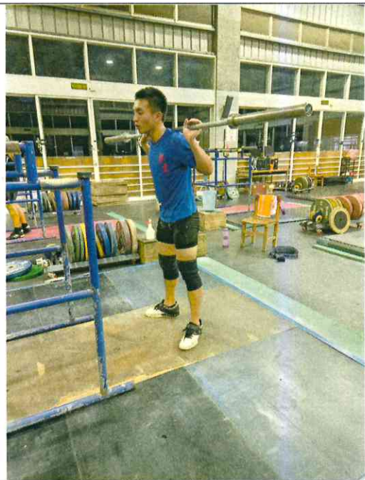
Back squat 示範動作(二)