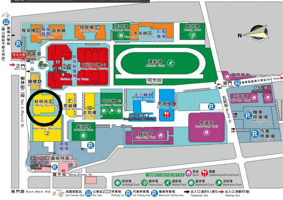
國立臺南大學 府城校區平面圖(正門) National University of Tainan Main Campus Map (Main Gate)